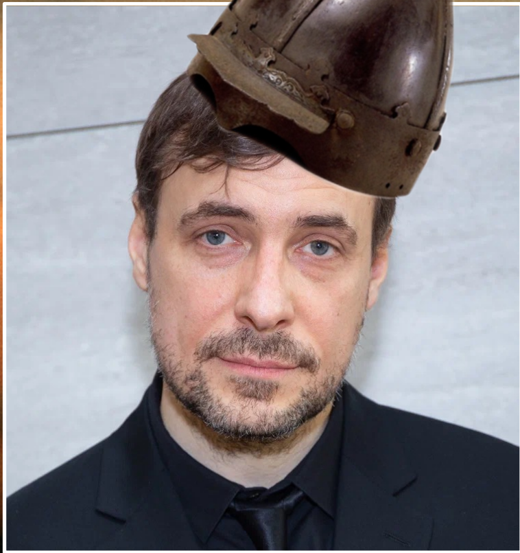
ВАЛЕРА ЕВГЕНИЙ ЦЫГАНОВ