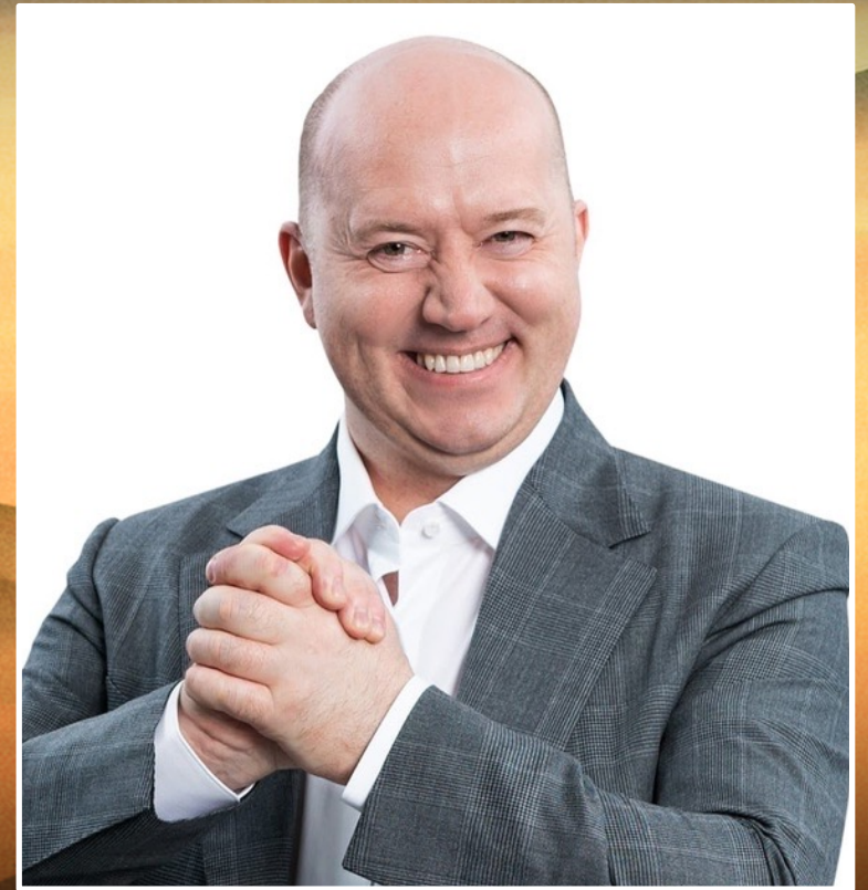
АНТОН СЕРГЕЙ БУРУНОВ