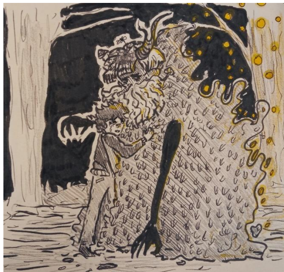
Эпизод 11: «Мой папа»