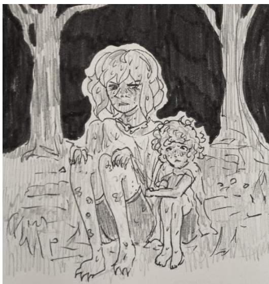
Эпизод 3: «Желание»