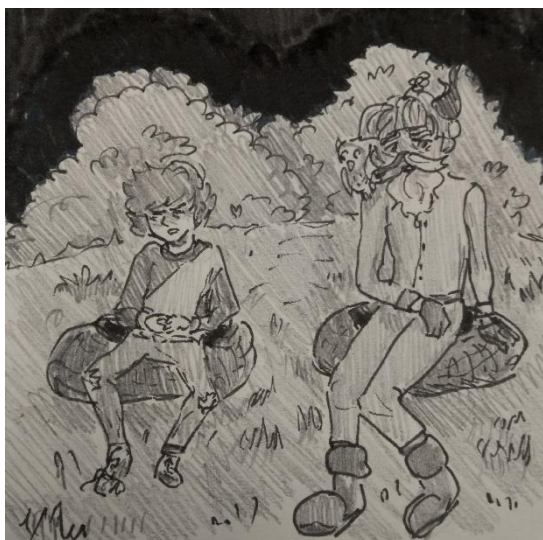
Эпизод 5: «Крах 2 – Новая надежда»