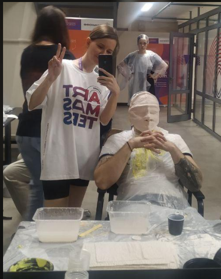
Снятие слепка с актера