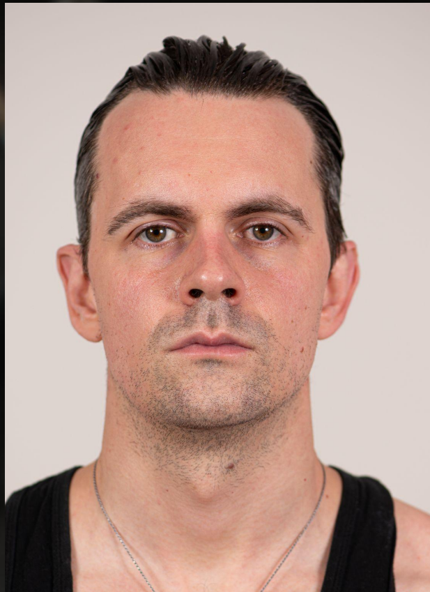
Фото до и после