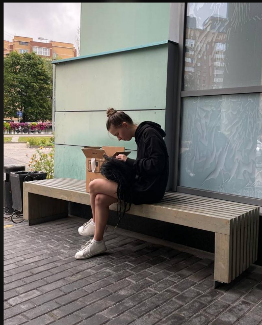
Тамбуровка (при любой возможности)