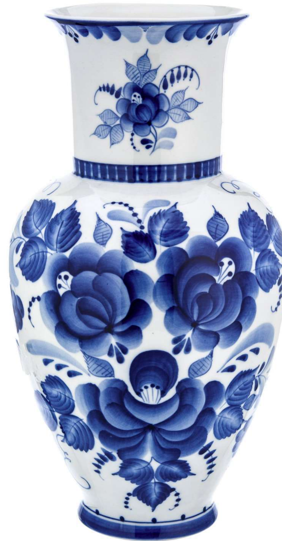
Ваза «Грозди рябины». Гжель, 2023