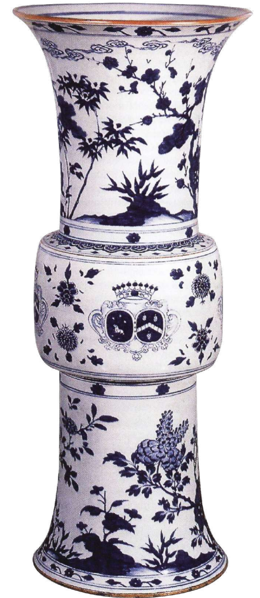
Ваза. Китай Начало XVIII веков